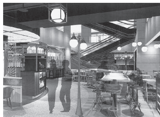
フードホールのイメージ

る9席のプレミアムバーとフロアの200席のためにドリンクを提供させていただくカジュアルバーの二面展開です。9月21日にはロマネ・コンティVS十四代と銘打ってイベントも開催します。