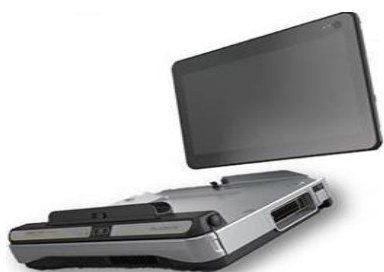
日立ARIETTA Prologue 院内でも往診でも使えるコンパクトサイズ。 上位機種並みの高画質です。