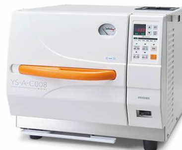
ユヤマ YS-A-C008 コストパフォーマンスに優れた セミオートクレープです。 定価 ¥ 380.000-