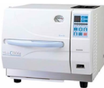
ユヤマ YS-A-C006J イラストキーでワンタッチ運転 セミオートです。 定価 ¥ 492.000-