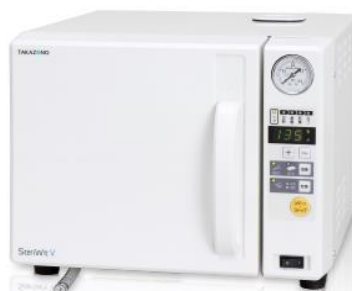
タカゾノ Steriwit-V セミオートです。毎回給水方式 ECOモード搭載。 定価 ¥ 358.000-