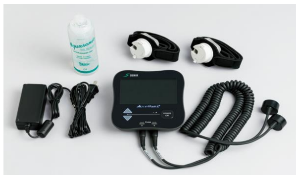
シングマックス超音波骨折治療器 アクセラス2 骨形成の促進に。2プローブ設計で的確で効率的な治療。超音波出力は2段階選択可能。AC電源・バッテリー選択可