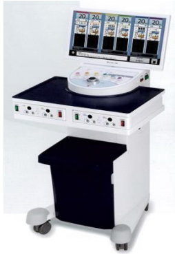
テクノリンク ネオテクトロンONE-P6 6つの出力波形で幅広い治療。症状に合わせたハンマーレベル設定。使いやすいディスプレイ。