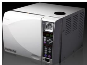
不二光学 HAC-240XP フルオートです。滅菌温度を安定化。 アラーム音声ガイド 定価 ¥ 578.000-