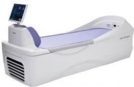
ミナト医科学 アクアタイザーQZ260 柔軟性向上につながる筋肉の選択的マッサージ(メディカルモード)搭載。高身長にも対応。