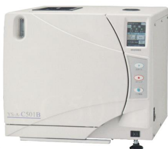
ユヤマ YS-A-C501B(クラスB準拠)

ヨーロッパ規格EN13060準拠の最高水準クラスB滅菌対応 滅菌前にチャンパー内の滞留空気を吸引して真空状態と加圧蒸気の 注入を繰り返し行うことで、従来の高圧蒸気滅菌器では滅菌できな かったチューブなどの中空品内部の空気を抜き取ったり、様々な 形状物のあらゆる機器等の滅菌が可能です。