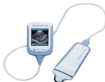
コニカミノルタ SonimageP3 わずか390g 内臓出血や腹水・胸水の有無などに 在宅診療・災害現場など、携帯可能な1台です。