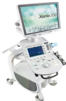
キャノンメディカル Xario200