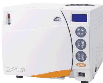
ユヤマ YS-A-C108 フルオートクレープです。静かです。 液体滅菌が可能です。 定価 ¥ 630.000-