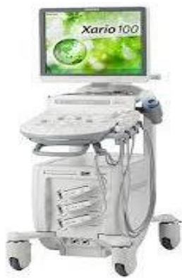
キャノンメディカル Xario100