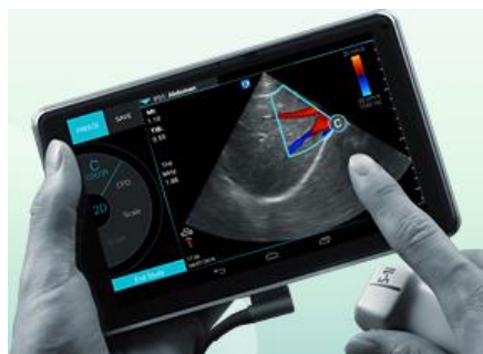
Fuji SonoSite iViz いつでも、どこでも。あらゆる臨床現場へ 液晶タッチスクリーン 驚異の高画質