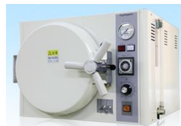
不二光学 HAC-220F 人気No1! この価格で フルオートです! 定価 ¥ 418.000-