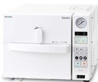
タカゾノ Steriwit フルオートです。吸水口とフィルターを 前面に配置で設置場所を選びません。 定価 ¥ 598.000-