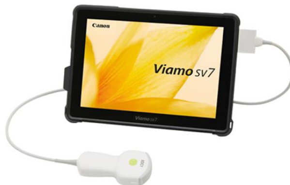
キャノンメディカル Viamo SV7 12インチモニター搭載 1.2kg 3時間バッテリー 256GBメモリー