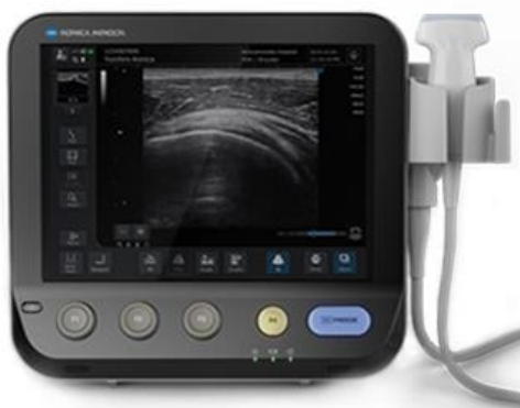
コニカミノルタ SonimageMX1 12.1インチモニター搭載 4.5kg 簡単操作で画像を最適化