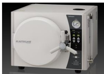
不二光学 HAC-220FD フルオートです。デジタル表示 定価 ¥ 458.000-