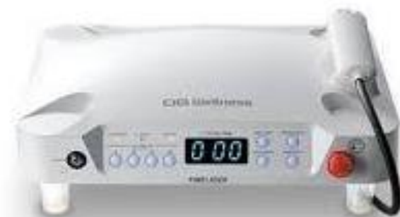
OG技研 ファインレーザー EL-1000 短時間で痛みを緩和する光作用によるレーザー治療。生体透過性の高い830mmの波長