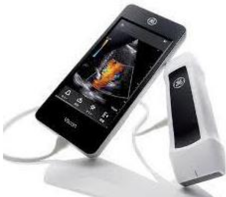
GE Vscan Extent リア・セクタ深触子搭載 436g・3.5インチディスプレイ

ここに掲載されていない機器もお取り扱いできます。デモのご用命もお気軽にお申し付け下さい。