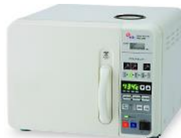
キャノンライフケア MAC-580 フルオートです。大型フロントパネルで 操作がラクです。 定価 ¥ 620.000-