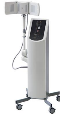
OG技研 マイクロサーミー (1基・2基) 独自の2wayアプリーケータにより体形・患部問わず治療できますワンタッチ伸縮アームで操作がラクラク。