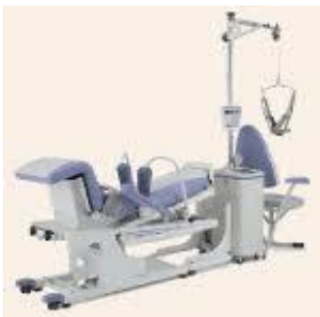
ミナト医科学 トラックタイザー シートのチルト角度を制御し、治療部位に適した牽引ポジションを提供