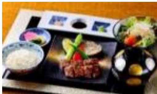
淡路牛ステーキ御膳

食の宝庫、御食国みけつくに淡路島。 温故知新を味わう“御食国の和食「宴-うたげ-」淡路島の選び 抜かれた食材を鉄板焼き・すき焼きで愉しむ「棧敷-さじき-」 古来より受け継がれた淡路島の海の幸、山の幸を厳選された 稀少な古酒と共にご堪能ください。